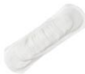
Tena Lady Extra Plus