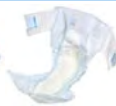
Attends Slip 9 Super Small