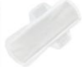
Sanisoft Mini Long vingar