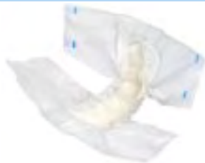
Abri-Form Air Plus 2 Large