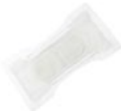
Attends Discrete 4