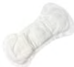
Saniline 2 Super