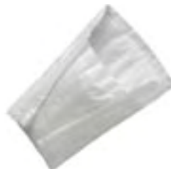
MoliMed for men active