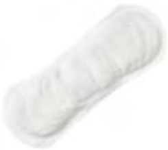
Tena Lady Normal