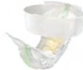
TENA Flex Super Small