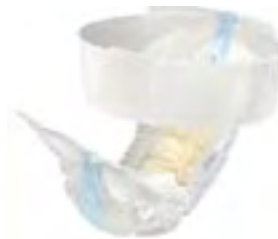
TENA Flex Plus Large