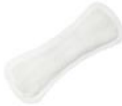
Abri-San Air Plus 1A