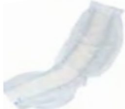
Attends Contours 6