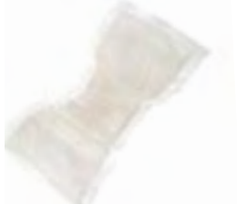
Attends Contours 5 Plus