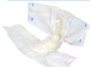
Abri-Form Air Plus 2 X-small