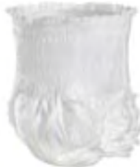
Abri-Flex 1 X-Large