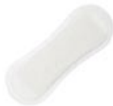
Sanisoft Mini Plus