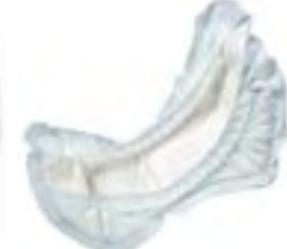
Attends Contours 10 Maxi Plus