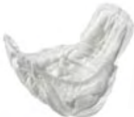
Abri-Man Formula 2