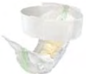
TENA Flex Super Large