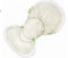
TENA Comfort Super