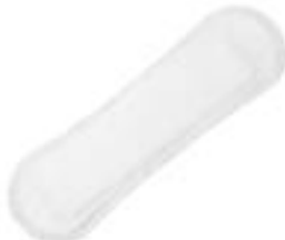
Sanisoft Mini Plus Long