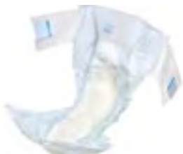
Attends Slip 10 Super Plus Small