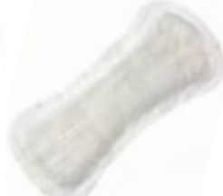
Abri-San Air Plus 1