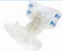
Attends Slip 9 Super X-small