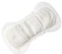
Saniline 2 Normal