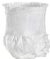
Abri-Flex 1 Medium