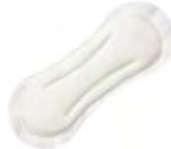
Sanisoft Anatomic Normal Air