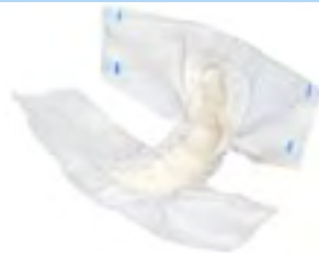
Abri-Form Air Plus 2 X-Large