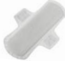
Sanisoft Mini vingar