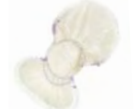
TENA Comfort Maxi