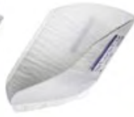
Attends for men 2