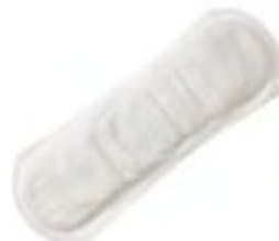
Tena Lady Extra