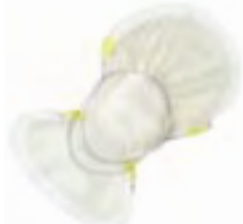
TENA Comfort Extra