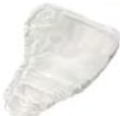
TENA for Men Nivå 2