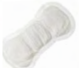
Saniline 2 Extra