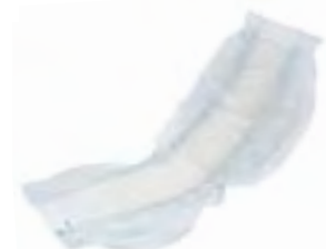
Attends Contours 7