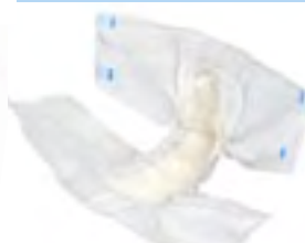
Abri-Form Air Plus 2 Small