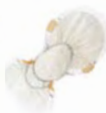
TENA Comfort Normal