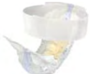
TENA Flex Maxi Small