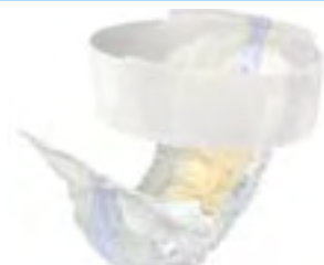
TENA Flex Maxi X-Large