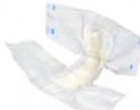
Abri-Form Air Plus 2 Medium