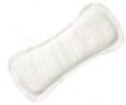
Saniline Mini Air