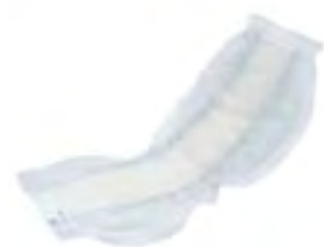
Attends Contours 9