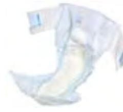
Attends Slip 9 Super Large