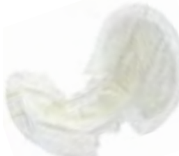
Abri-San Air Plus 11