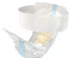
TENA Flex Plus Small