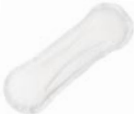
Sanisoft Anatomic Extra Air