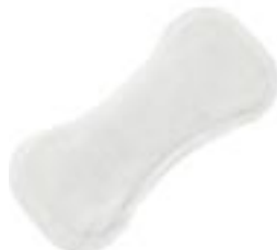
Attends Discrete 2