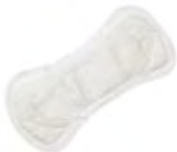
Abri-San Air Plus 3