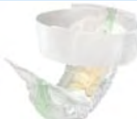
TENA Flex Super X-large