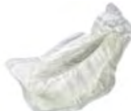
MoliMed for men protect