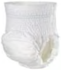
MoliCare Mobile Small