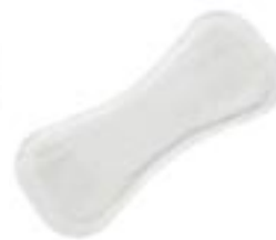
Attends Discrete 1