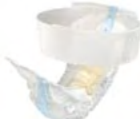
TENA Flex Plus Medium