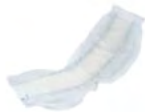
Attends Contours 8