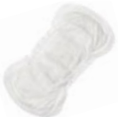
Abri-San Air Plus 2