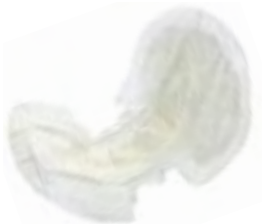
Abri-San Air Plus 5