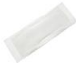
Attends Discrete 3