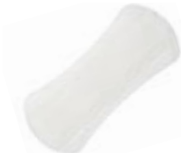
Abri-San Air Plus 0