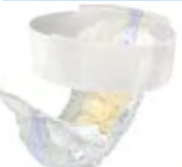
TENA Flex Maxi Large