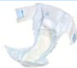
Attends Slip 10 Super Plus Medium