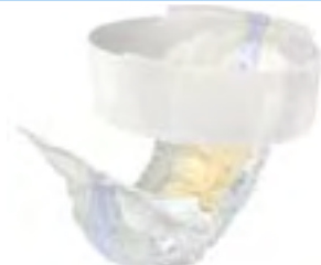
TENA Flex Maxi Medium Stockholm 2 April 2007