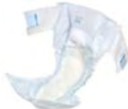
Attends Slip 8 Extra Large