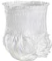
Abri-Flex 1 Large