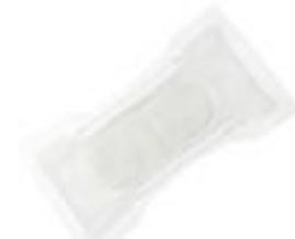
Attends Contours Air Comfort