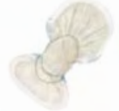
TENA Comfort Plus