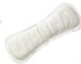
Saniline 1 Mini Long Air