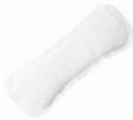
Tena Lady Mini Plus