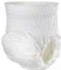
MoliCare Mobile Medium Stockholm 2 April 2007