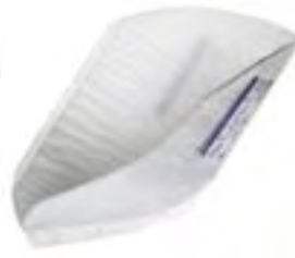
Attends for men 1